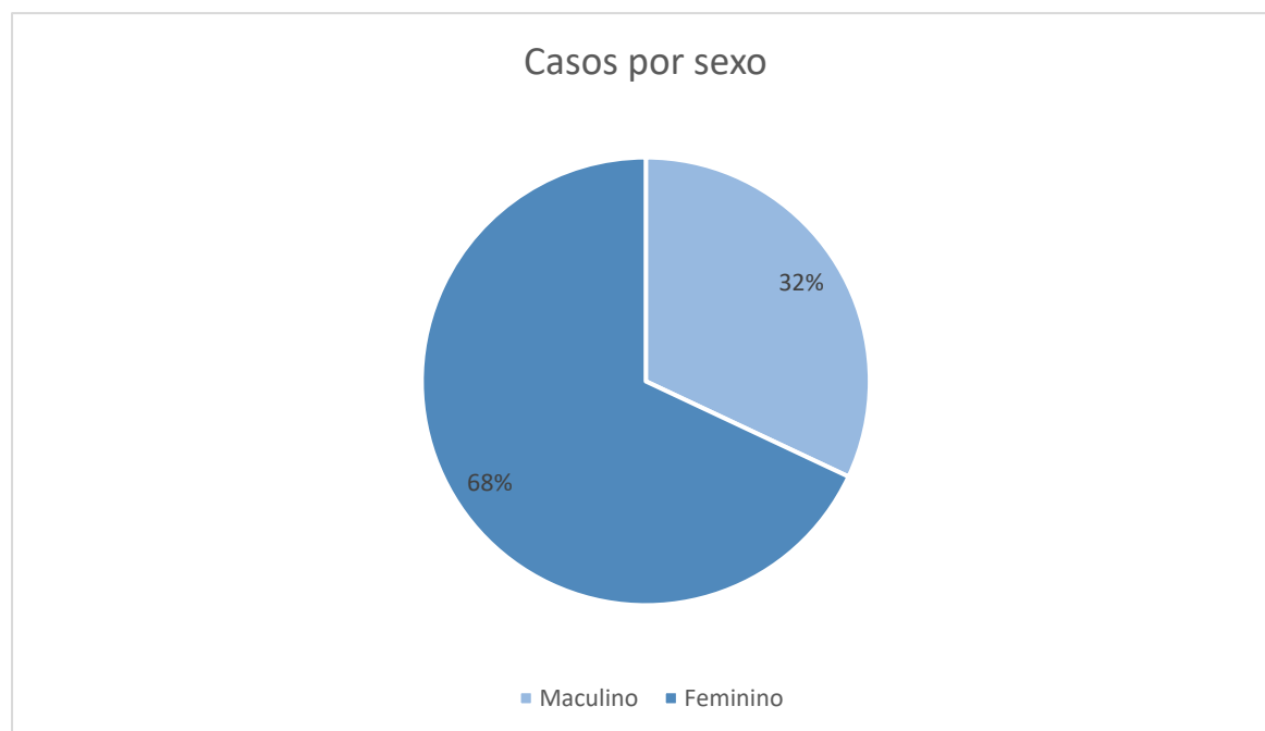
Gráfico III: casos por sexo